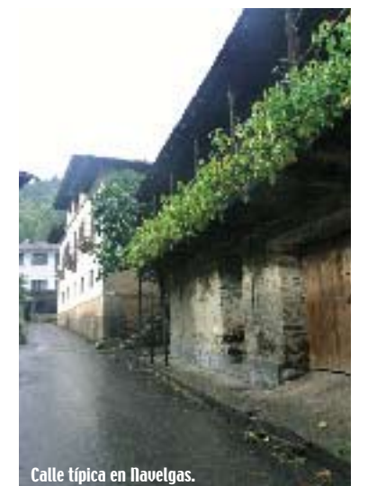
Calle típica en Navelgas.