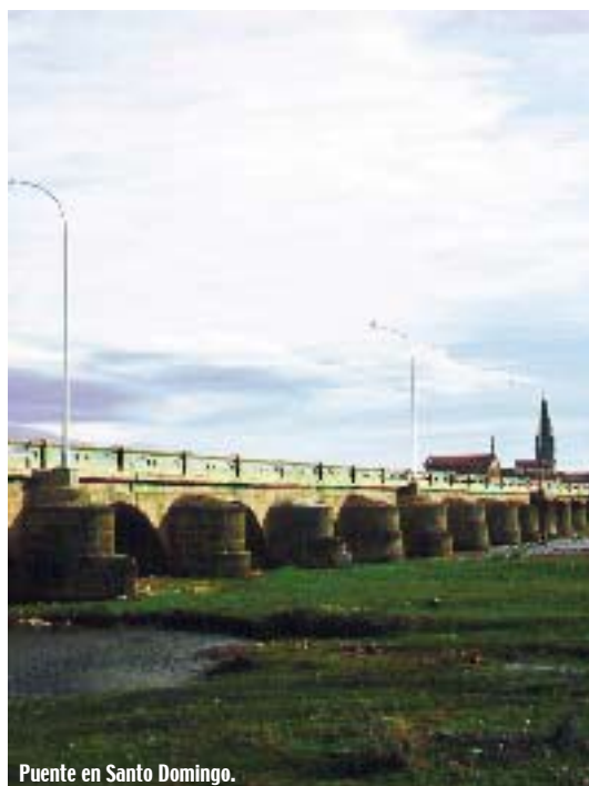
Puente en Santo Domingo.

La Catedral del Salvador es el único ejemplo de Iglesia-fortaleza que podemos contemplar en La Rioja. La estructura de este complejo defensivo se nos presenta hoy como un sólido cuerpo cúbico, de concepción muy original. También es destacable el Convento de San Francisco, de estilo herreriano y hermoso claustro de planta rectangular.