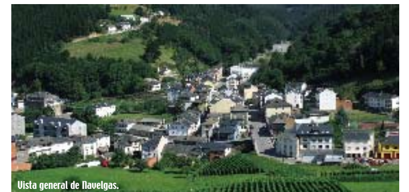
Vista general de Navelgas.

cuidado y difusión de su entorno, con rutas de naturaleza de carácter educativo, para que los visitantes puedan disfrutar de su naturaleza. Asimismo, dedican parte de sus esfuerzos a la recuperación de actividades tradicionales como la fabricación artesanal de madreñas, la celebración de los festivales del esfoyón y el amagüestu, y el concurso comarcal de bolos celtas, un juego rescatado del olvido en esta población. El visitante también puede disfrutar con la riqueza patrimonial de esta zona, que, aunque poco conocida, es excelente.