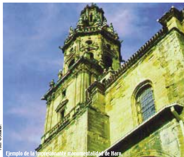
Ejemplo de la impresionante monumentalidad de Haro.

HARO, COMO TODA LA RIOJA, ES TIERRA DE FRONTERA. CAPITAL DEL VINO, HARO HA JUGADO UN PAPEL PROTAGONISTA EN LA HISTORIA Y SUS PIEDRAS SECULARES NOS HABLAN LOS INTENSOS AVATARES VIVIDOS.