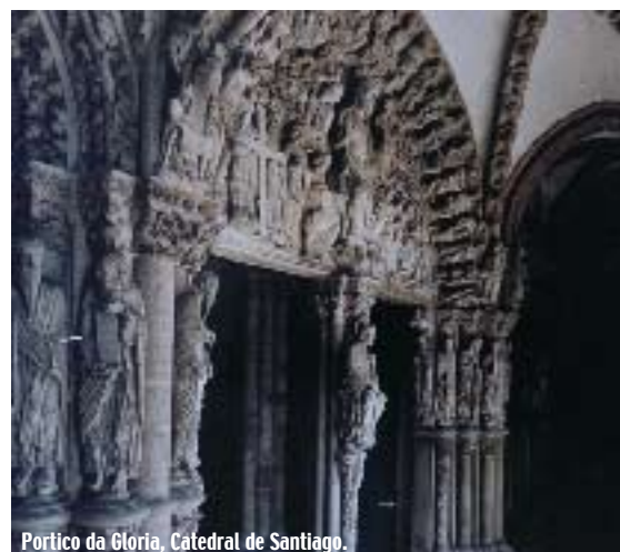
Portico da Gloria, Catedral de Santiago.

Teléfono de Información Xacobeo 2004: 981 572 004. E-mail: informacion.xacobeo@xunta.es www.xacobeo.es