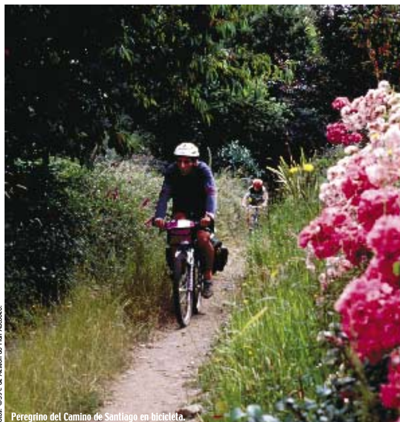
Peregrino del Camino de Santiago en bicicleta.

GALICIA SERÁ DURANTE EL AÑO 2004 UN ESPACIO PRIVILEGIADO PARA EL ENCUENTRO CON EL ESPÍRITU, LA HISTORIA Y LA CULTURA EUROPEAS. EL MOTIVO ES LA CELEBRACIÓN DEL PRIMER AÑO JUBILAR COMPOSTELANO DE ESTE MILENIO, EN LA CIUDAD DE SANTIAGO DE COMPOSTELA.