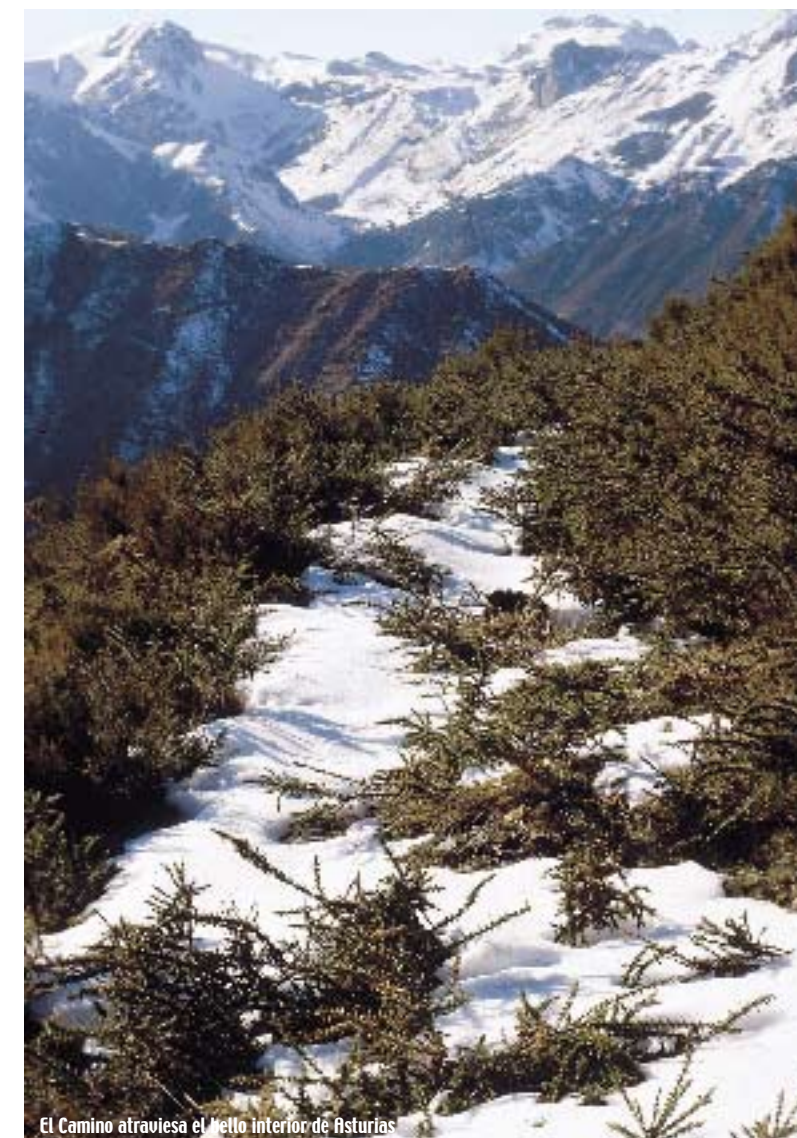
El Camino atraviesa el bello interior de Asturias.

Tras atravesar varios concejos, y cruzar el río Nalón, el camino alcanza Grado, villa que tuvo murallas y un primer templo parroquial románico, así como hospital. Después se atraviesa el valle del Narcea donde se levanta el gran monasterio cisterciense de Cornellana. De allí el peregrino puede continuar a Salas, con la hermosa iglesia-colegiata de Santa María la Mayor. De Salas, el camino asciende hasta el alto de la Espina, donde se vis-