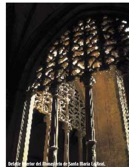
Detalle interior del Monasterio de Santa María La Real.

Con Sancho Garcés III el Mayor (1004-1035), denominado "Rex Hispaniarum", alcanzó Nájera la cima de su fama y esplendor, como capital de un gran imperio que abarcaba todas las tierras reconquistadas hasta el momento, y se extendía desde las costas de Galicia hasta el Condado de Barcelona y más allá de los Pirineos hasta Toulouse. Nájera mantuvo su preminencia durante toda la Edad Media. Fruto de esta circunstancia nos ofrece un patrimonio monumental de gran valor, fiel reflejo de esta etapa apasionante de la historia de España. El magnífico Monasterio de Santa María La Real es el monumento más importante y centro del interés histórico y artístico de la ciudad, y de toda la zona., incluido dentro de la interesante ruta de los monasterios riojana. Aunque su origen se remonta hacia principios del siglo XI no fue hasta el primer cuarto del siglo XV cuando la iglesia toma el aspecto que actualmente presenta a los visitantes. Reconstruida en estilo gótico y renacentista, su irregular estructura delata las diferentes fases de su construcción. Destacan dentro del monasterio la iglesia y el espléndido claustro como sus elementos más significativos, los cuales por sí solos ya merecen una visita detenida.