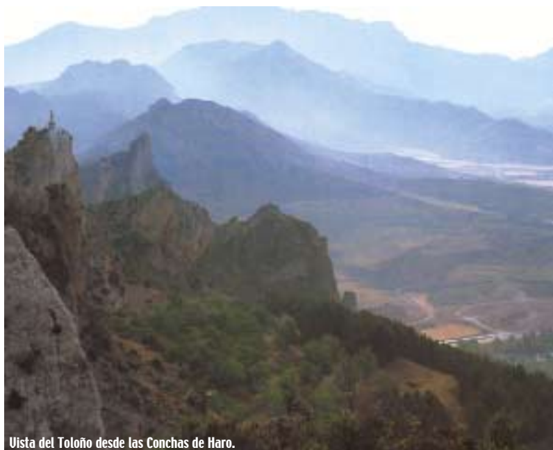
Vista del Toloño desde las Conchas de Haro.

LAS TIERRAS DE LA RIOJA FORMAN UN MOSAICO PERFECTO, DONDE ENCAJAN LAS MÁS IMPORTANTES PIEZAS DE LA HISTORIA DE ESPAÑA. DESDE LOS PRIMEROS PASTORES DEL NEOLÍTICO, LOS DÓLMENES DE CAMEROS Y LA SONSIERRA, LAS TRIBUS CELTÍBERAS EN EL VALLE DEL EBRO Y LAS CIUDADES ROMANAS, HASTA LOS RECORRIDOS POR EL ARTE ROMÁNICO, GÓTICO, RENACENTISTA Y BARROCO.