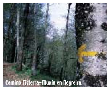
Camino Fisterra-Iluxía en Negreira.