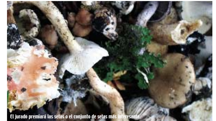
El jurado premiará las setas o el conjunto de setas más interesante.

Uno de las actividades paralelas más atractivas para los participantes y turistas es la oferta gastronómica que las jornadas traen consigo.