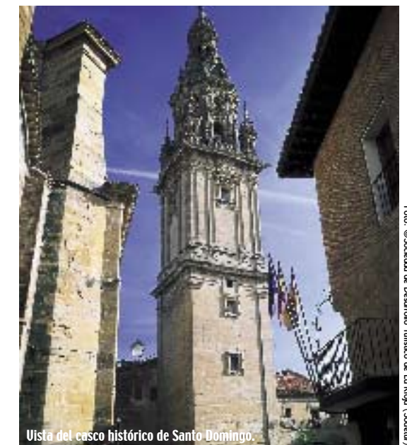
Vista del casco histórico de Santo Domingo.

Se puede visitar el espléndido conjunto monumental de Santo Domingo tomando un camino rural a la altura de la fábrica La Feculera. Tras dejar atrás la villa, el viajero puede hacer una parada interesante en el Apeadero de La Carrasquilla, una evocadora réplica del antiguo apeadero ferroviario. Más adelante (en el kilómetro 18,5) se atraviesa el habitualmente seco arroyo de Santurdejo, cuyo magro cauce, en alguna inesperada crecida, se llevó por delante el pontón del ferrocarril. Se trata de obra menor que la Vía Verde del Oja va a recuperar para facilitar el camino al viajero.