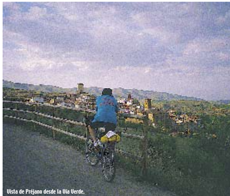
Vista de Préjano desde la Vía Verde.

PRÉJANO, VILLA PROPUESTA PARA SER RESERVA DE LA BIOSFERA, SE ENCLAVA EN UN PARAJE NATURAL DE ENSUEÑO, MUY PRÓXIMO AL MÁS QUE INTERESANTE YACIMIENTO DE HUELLAS FÓSILES DE DINOSAURIOS DE VALDEMURILLO. EN ESTA LOCALIDAD ACABA LA VÍA VERDE QUE LLEVA SU NOMBRE, UN CORTO PERO ATRACTIVO RECORRIDO QUE DISCURRE POR UN ANTIGUO FERROCARRIL MINERO. LOS YACIMIENTOS CON HUELLAS FÓSILES DE DINOSAURIOS SE DAN CON PRODIGALIDAD EN ESTA ZONA, LA DEL VALLE DE CIDACOS, PUNTO ÁLGIDO DE LA DENOMINADA RUTA DE LOS DINOSAURIOS, UNO DE LOS PRODUCTOS TURÍSTICOS MÁS ATRACTIVOS DE LA RIOJA.