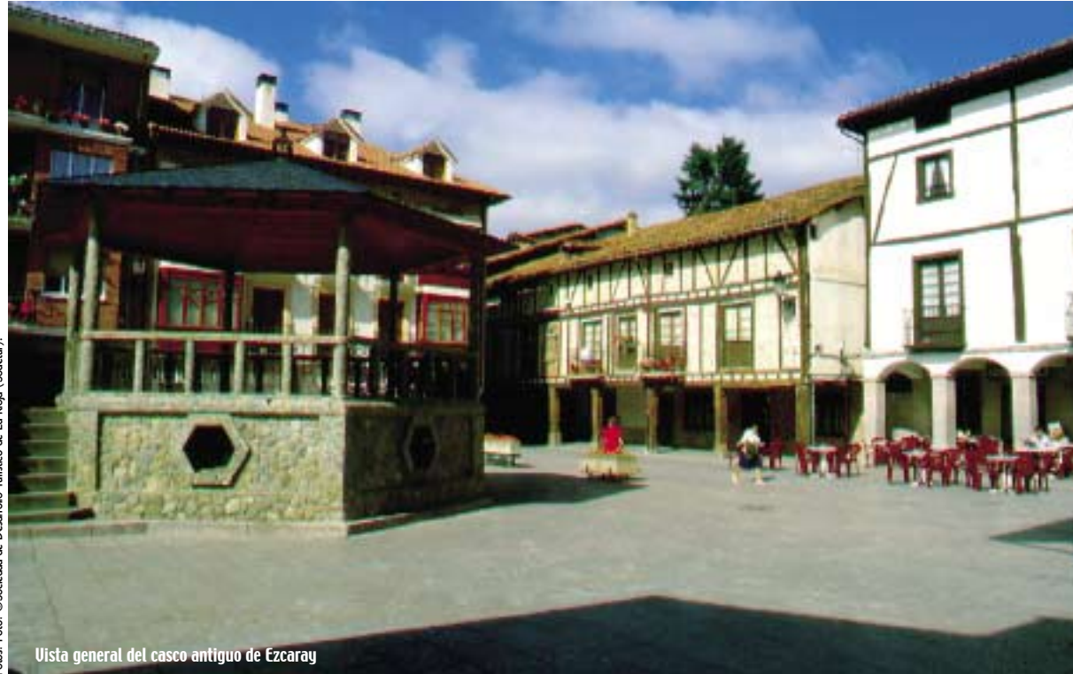
Vista general del casco antiguo de Ezcaray

EZCARAY, ENCLAVADA EN LA SIERRA DE LA DEMANDA, A ORILLAS DEL RÍO OJA, OFRECE AL VIAJERO UN PAISAJE IDÓNEO TANTO PARA AQUELLOS QUE BUSCAN TRANQUILIDAD Y SOSIEGO COMO PARA LOS AMANTES DE LOS DEPORTES DE MONTAÑA, GRACIAS A LA REPUTADA ESTACIÓN DE SKY DE VALDEZCARAY, PUNTO DE ENCUENTRO NACIONAL DE LOS AMANTES DE ESTE DEPORTE. ADEMÁS DE PROTAGONISTA DE LA VÍA VERDE DEL OJA, EZCARAY ES EL PUNTO DE ORIGEN DE DIVERSOS CAMINOS, PASEOS TRAZADOS PARA EL DELEITE DE LOS AMANTES DEL TURISMO RURAL Y DE NATURALEZA. I