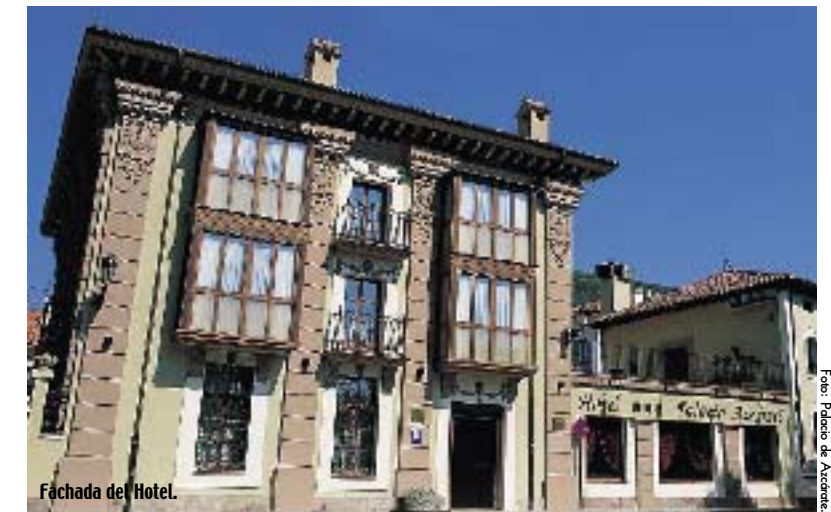
Fachada del Hotel.

La edificación perteneció en su época a los Azcárate, familia de rancio abolengo estrechamente vinculada a la historia de la zona. El establecimiento conserva sus señas de identidad gracias a una reciente reforma en la que se ha respetado minuciosamente su señorial arquitectura, así como la decoración interior, que respira clasicismo y buen gusto. Dotado de todas las comodidades modernas, pone a disposición de sus clientes 16 habitaciones dobles, 2 individuales y 1 suite con bañera de hidromasaje, todas ellas