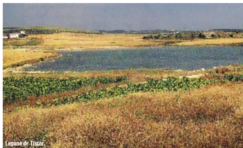
Laguna de Tiscar.

rehabilitando, poniéndola en valor para disfrute del viajero. Ya en el término municipal de Lucena nos sale al paso la Laguna Amarga. De aguas permanentes, está rodeada de una espléndida vegetación palustre que le confiere un aspecto peculiar. Entre especies vegetales como el carrizo y el taraje, crece una importante población de fauna, entre la que podemos destacar de nuevo la malvasía, el calamón y una enorme cantidad de anátidas (porrón moñudo) y de ráldas como la focha común. Cercana a la Laguna Amarga se localiza una laguna de aguas estacionales, denominada Laguna Dulce; al perder el agua en verano, la visita a la misma conviene realizarle en los meses invernales o primaverales.