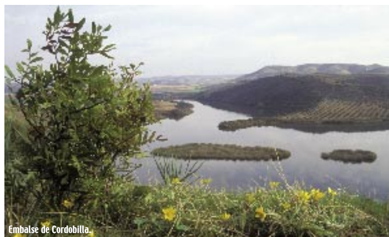
Embalse de Cordobilla.

Cercana a otro bello pueblo, Puente Genil, el viajero descubrirá la Laguna de Tiscar, una zona húmeda salobre de carácter estacional. Famosa por sus espectaculares flamencos, la han elegido como cuartel de invierno especies como el ánade real, el ánade silbón, el ánade rabudo y el pato cuchara, aunque actualmente cuenta con una de las mayores poblaciones de malvasía de la zona.