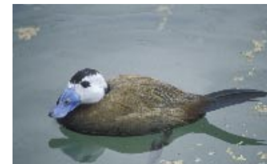
Malvasía (Oxyura leucocephala).