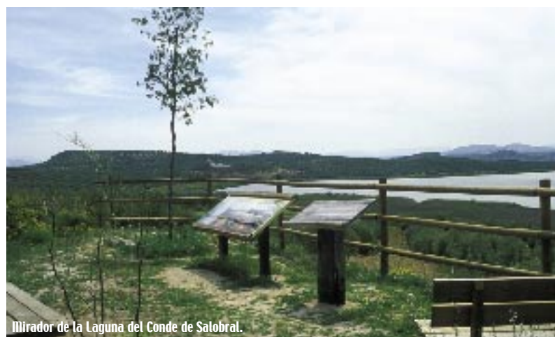
Mirador de la Laguna del Conde de Salobral.