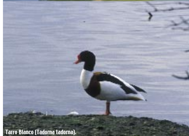
Tarro Blanco (Tadorna tadorna).

cerros y sierras de suave relieve. El carácter temporal de sus aguas y la elevada concentración de sales facilitan la presencia de plantas tanto halófitas como salicornias o brezos de mar. Entre las especies animales interesantes que en ella pueden encontrarse el flamenco, el ánsar común y el sisón.