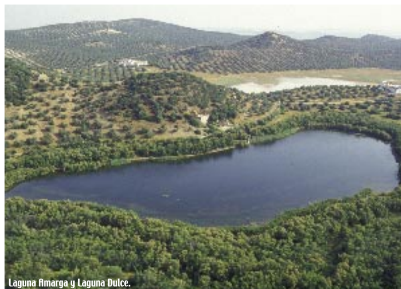
Laguna Amarga y Laguna Dulce.

Las lagunas, sobre todo las de aguas permanentes, se encuentran rodeadas en general por un cinturón