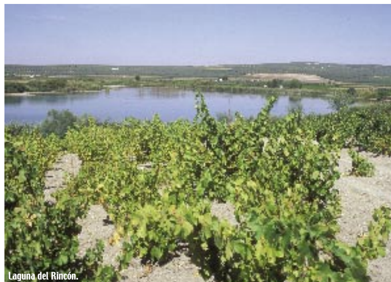
Laguna del Rincón.

de vegetación formado por eneas, carrizos y cañas, lo que las aísla del exterior y permiten la existencia de las aves acuáticas que otorgan a estos lugares el enorme valor medioambiental que poseen.