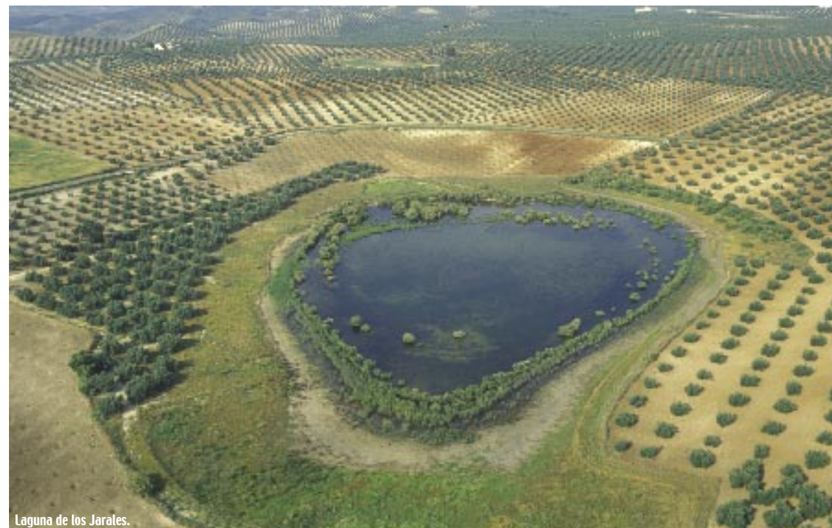
Laguna de los Jarales.

La ruta comienza en el término municipal Aguilar de la Frontera, en la Laguna de Zóñar, la mayor y más importante de este extenso complejo húmedo cordobés, por lo que está dotada con excelentes equipamientos de uso público, entre los que destacan dos centros de visitantes, uno en uso y otro de próxima apertura.