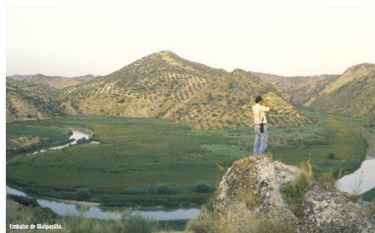
Embalse de Malpasillo.

Espacios Naturales: Humedales de Córdoba