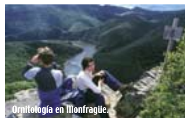
Ornitología en Monfragüe.