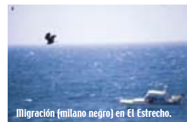
Migración (milano negro) en El Estrecho.