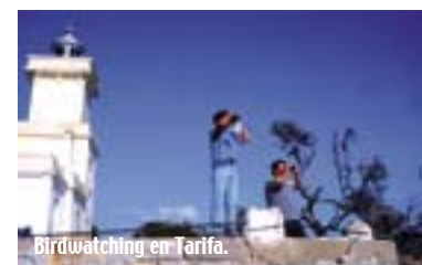
Birdwatching en Tarifa.