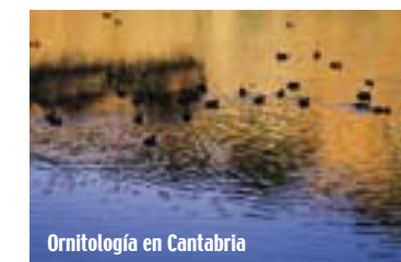
Ornitología en Cantabria