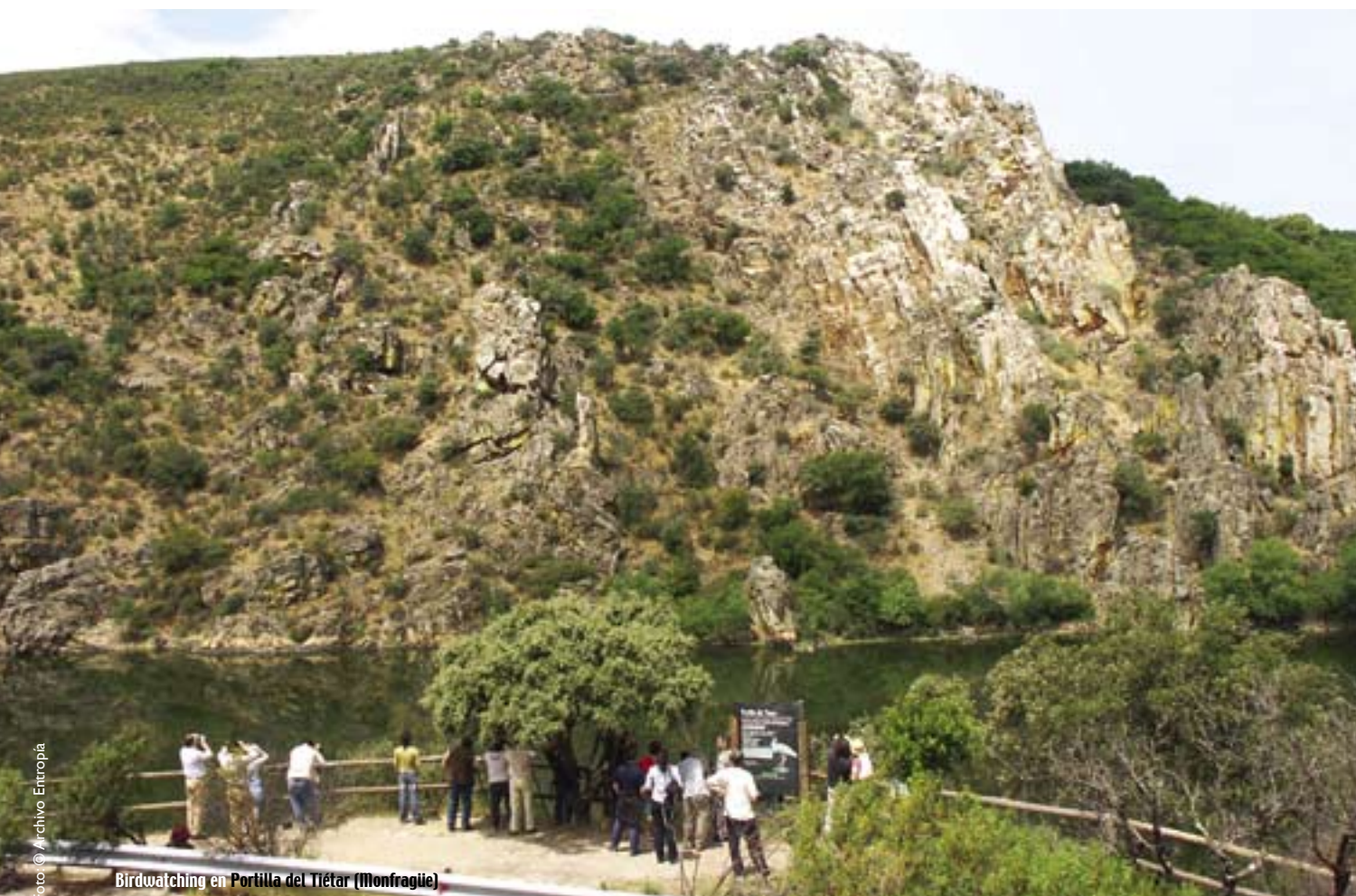
Birdwatching en Portilla del Tiétar (Monfragüe)