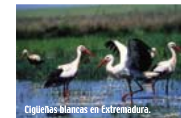
Cigüeñas blancas en Extremadura.

Ctra. Nal. 340, km. 78,5. 11380 Tarifa (Cádiz) Tel.: 639 859 350 http://cocn.tarifaifo.com Valiosos guías para vivir el Paso migratorio del Estrecho.