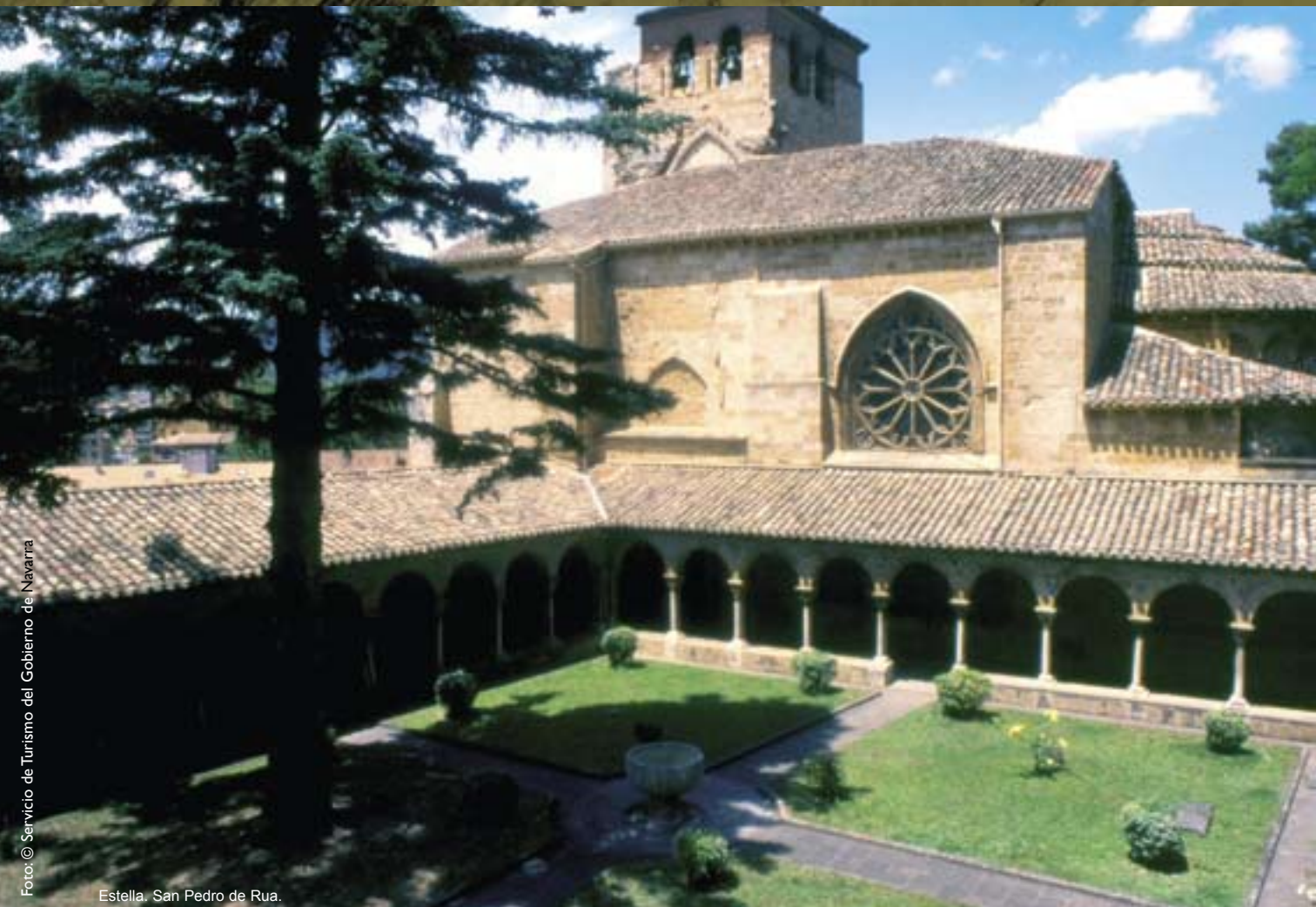
Estella. San Pedro de Rúa.