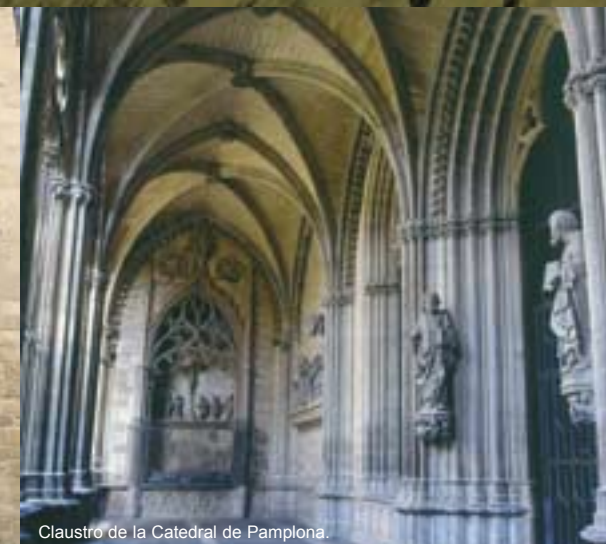
Claustro de la Catedral de Pamplona.

La ruta jacobea a su paso por Navarra ofrece al peregrino una variada red de alojamientos que abarcan desde los albergues a los hoteles de cuatro y cinco estrellas de Pamplona, pasando por toda una red de casas rurales, hostales y hoteles rurales.