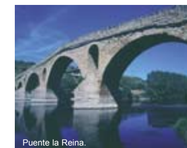
Puente la Reina.

Saturnino y recorrer las calles del casco antiguo. Los próximos enclaves de esta ruta son pequeños municipios como Cizur Menor, Gazólaz, Sagüés, Paternáin, Astráin, Uterga y Obanos.