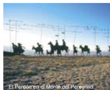
El Perdón en el Monte del Peregrino.

La ruta jacobea a su paso por Navarra ofrece al peregrino una variada red de alojamientos que abarcan desde los albergues a los hoteles de cuatro y cinco estrellas de Pamplona, pasando por toda una red de casas rurales, hostales y hoteles rurales.