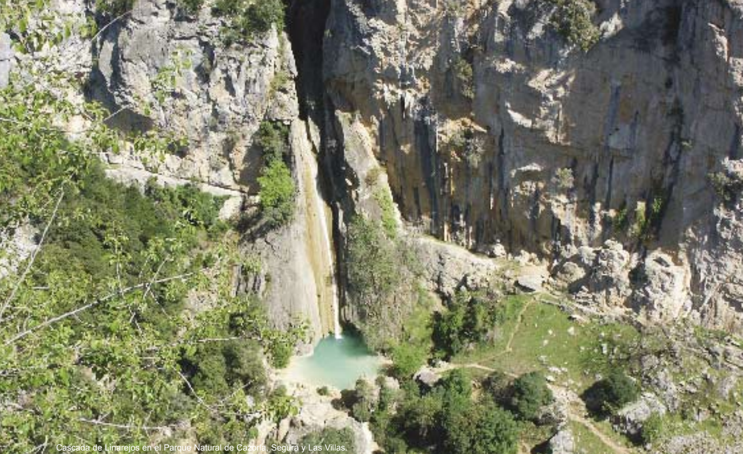
Cascada de Linarejos en el Parque Natural de Cazorla, Segura y Las Villas.