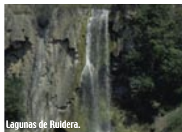
Lagunas de Ruidera.