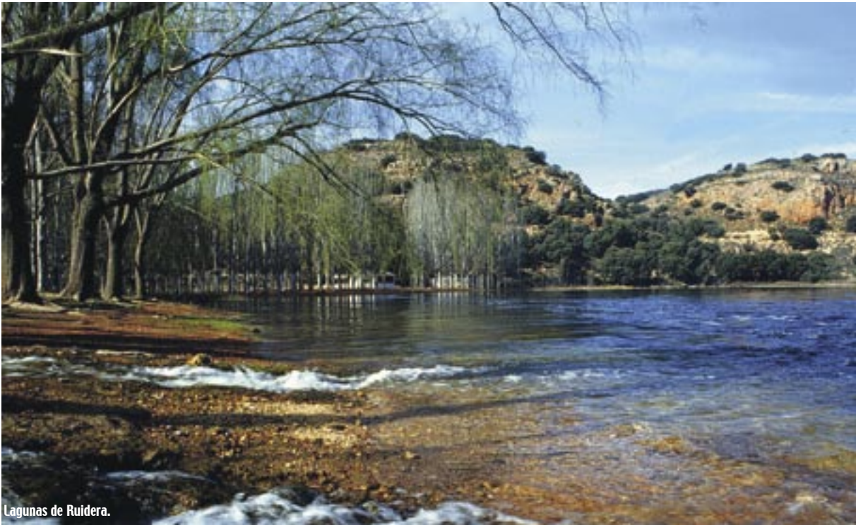
Lagunas de Ruidera.