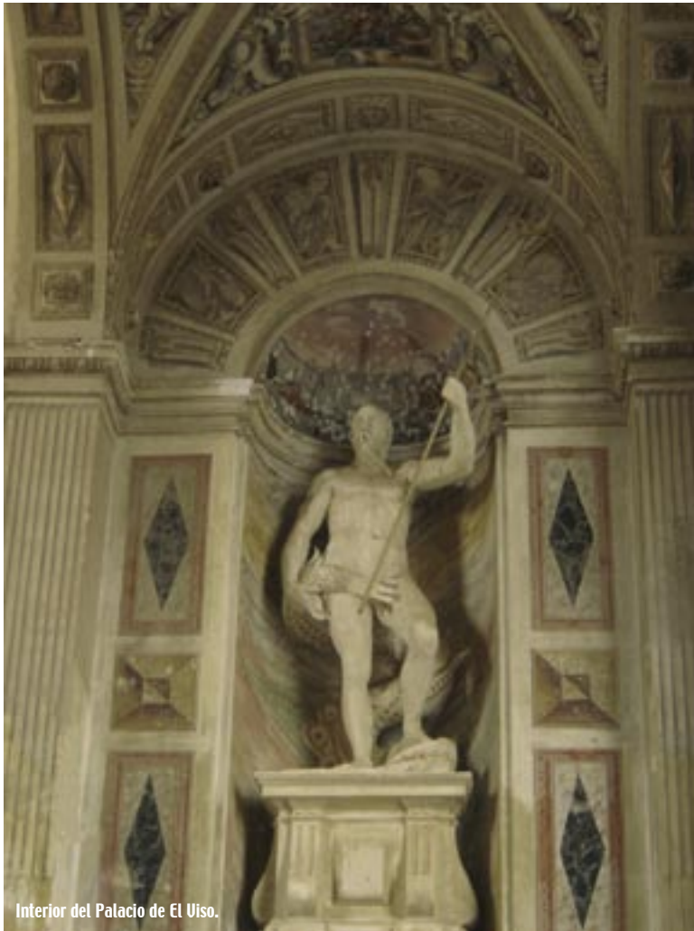
Interior del Palacio de El Uiso.