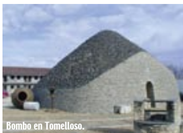
Bombo en Tomelloso.