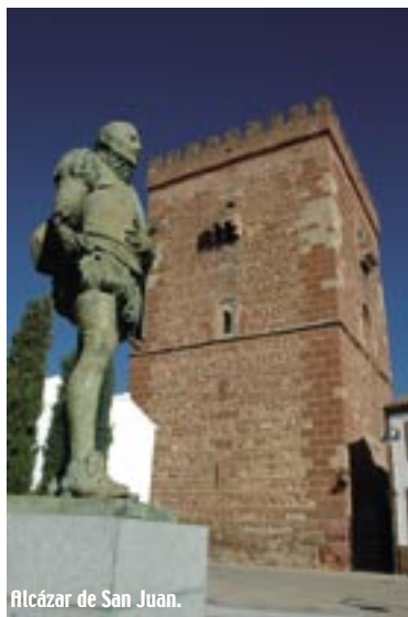
Alcázar de San Juan.