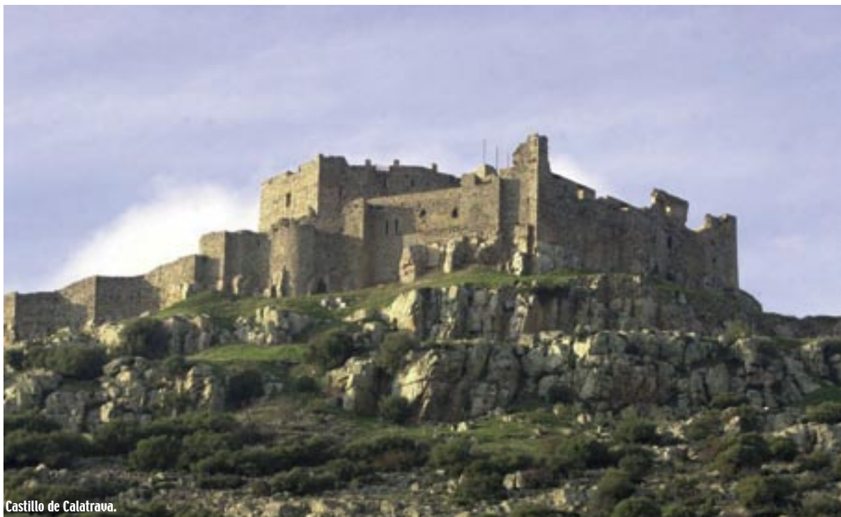
Castillo de Calatrava.