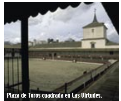
Plaza de Toros cuadrada en Las Virtudes.