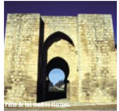
Patio de las madres clarisas.