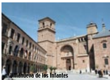
Ullanueva de los Infantes