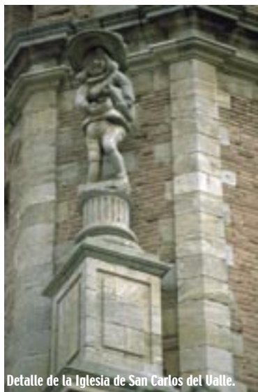
Detalle de la Iglesia de San Carlos del Valle.