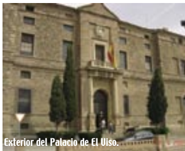
Exterior del Palacio de El Uiso.