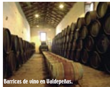
Barricas de vino en Valdepeñas.

en su genero, proporcionando una gran diversidad ecológica.