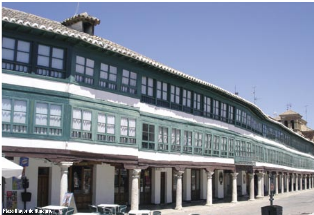
Plaza Mayor de Almagro.