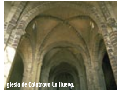
Iglesia de Calatrava La Nueva.