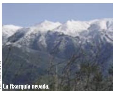
La Axarquía nevada.