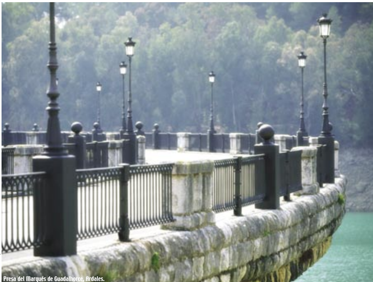
Presa del Marqués de Guadalhorce, Ardales.