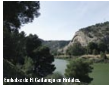
Embalse de El Gaitanejo en Ardales.