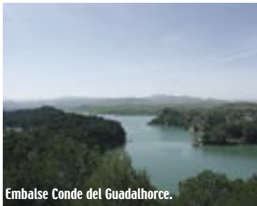
Embalse Conde del Guadalhorce.