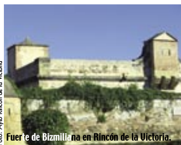
Fuerte de Bizmillana en Rincón de la Victoria.

que las fachadas de cal y la herencia mozárabe dan un toque especiado y muy genuino. Porque desde siempre estas montañas han estado plagadas de rumores y leyendas sobre bandideros, contrabandistas, furtivos o resistencia.