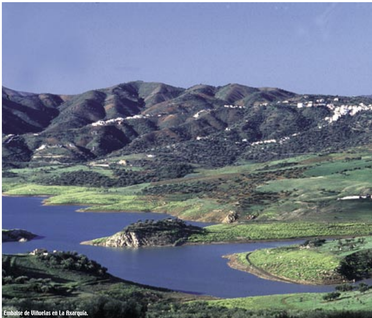
Embalse de Uñuelas en La Axarquía.