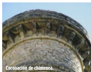
Coronación de chimenea.