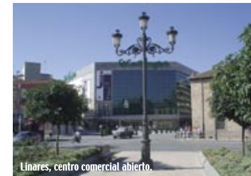
Linares, centro comercial abierto.

La ciudad de Linares es también un centro comercial al aire libre, donde junto al comercio tradicional hallamos franquicias punteras y grandes superficies.