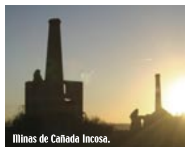
Minas de Cañada Incosa.