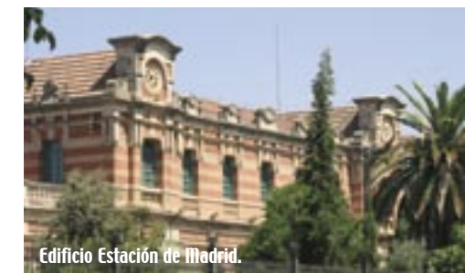
Edificio Estación de Madrid.

Además, una vez al año, Linares se convierte en la capital mundial del ajedrez, al acoger el Torneo Internacional de Ajedrez Ciudad de Linares, uno de los más prestigiosos a nivel internacional y por el que cada año pasan las máximas figuras mundiales de esta disciplina.