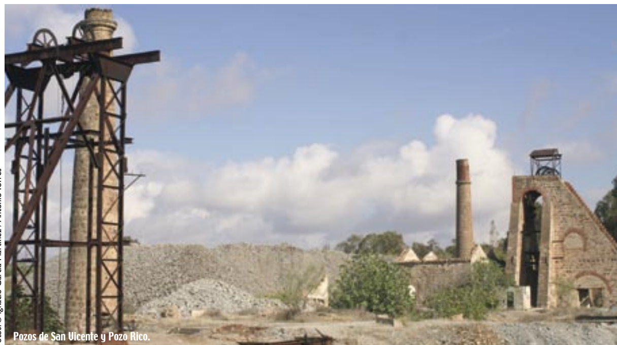
Pozos de San Vicente y Pozo Rico.