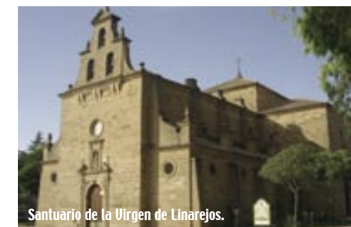
Santuario de la Virgen de Linares.