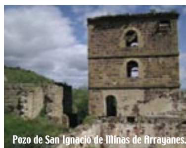
Pozo de San Ignacio de Minas de Arrayanes.