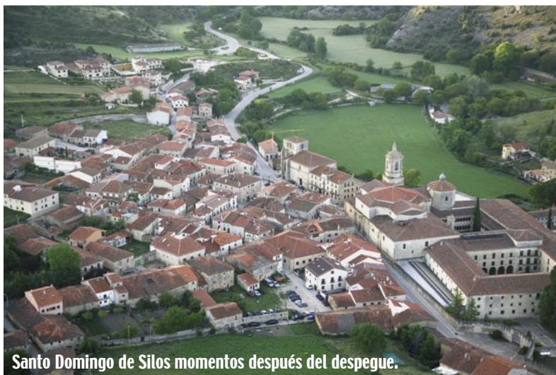
Santo Domingo de Silos momentos después del despegue.

Los vuelos en globo descubren paisajes insólitos. Arriba, atardecer en el Parque Natural del Cañón del Río Lobos. En la página anterior el Castilla de Pedraza (Segovia) en el Espacio Natural Sierra de Guadarrama. Junto a estas líneas, Santo Domingo de Silos en el Espacio Natural Sabinas del Arlanza (Burgos). El diseño de la vela y el color blanco del fondo pretenden representar el respeto al medioambiente integrando al mismo tiempo la imagen corporativa de la Fundación Patrimonio Natural de Castilla León.