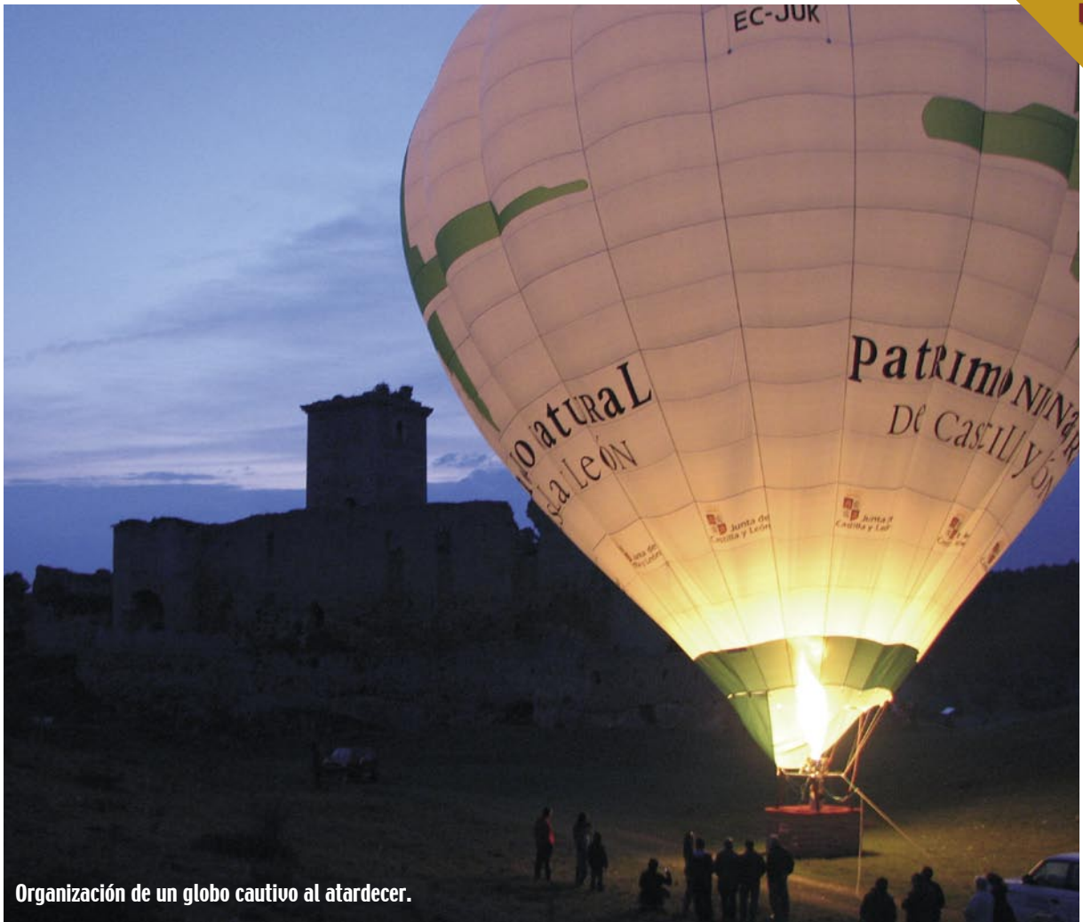
Organización de un globo cautivo al atardecer.