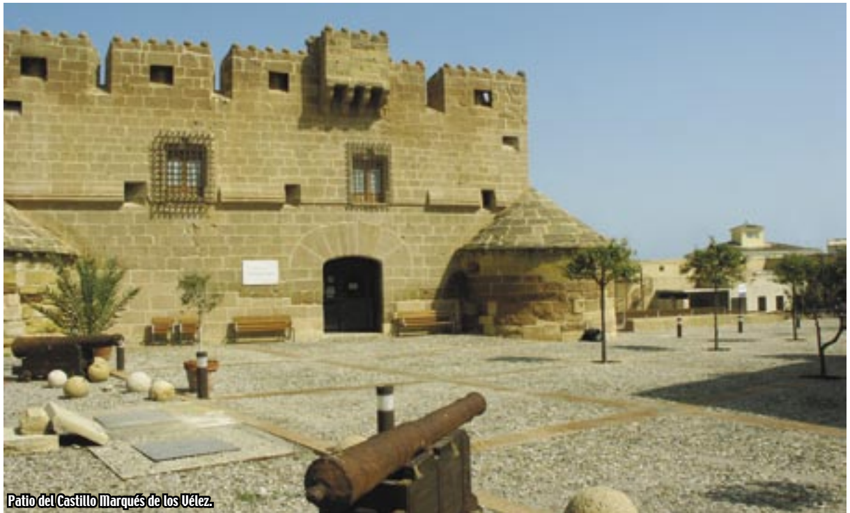
Patio del Castillo Marqués de los Vélez.