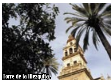
Torre de la Mezquita.