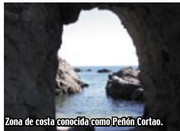
Zona de costa conocida como Peñón Cortao.