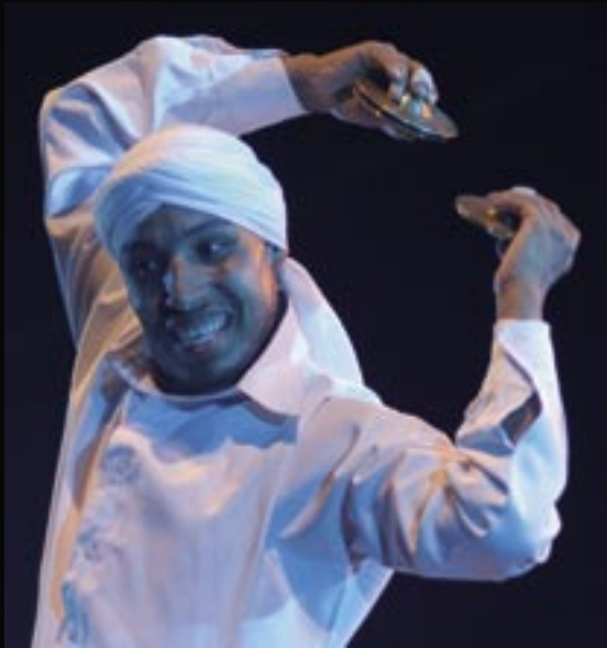
Danzarín derviche en el Festival 2007.