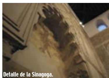
Detalle de la Sinagoga.