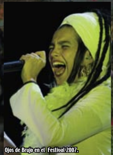
Ojos de Brujo en el Festival 2007.

El festival cuenta con actuaciones musicales de alto nivel artístico en un entorno relajado y familiar; conferencias sobre temas relacionados con las tres culturas, exposiciones, jornadas gastronómicas y una muestra de la gastronomía popular en la ya muy exitosa Ruta de la Tapa en diferentes bares del pueblo. Las actividades de animación de calle incluyen pasacalles con música, juegos malabares, fakir, danza del vientre y también actividades infantiles con juegos tradicionales, cuentacuentos, teatro infantil, títeres.... Todo ello con un mercado de las tres culturas en el que se ofrecen originales productos al visitante llenando las calles con un ambiente cosmopolita y festivo.