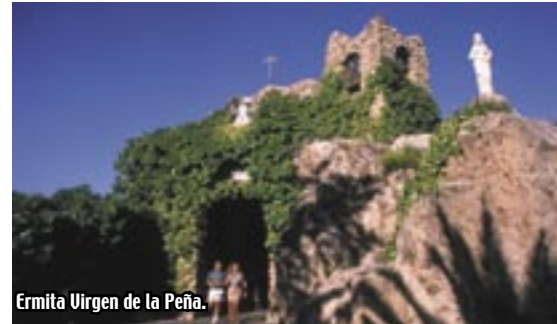
Ermita Virgen de la Peña.