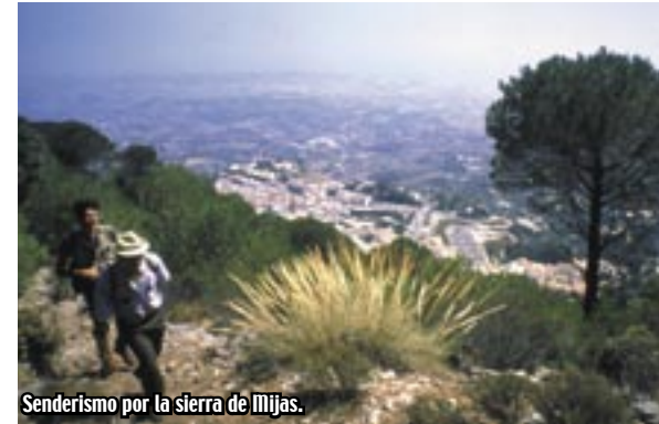
Senderismo por la sierra de Mijas.