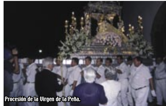
Procesión de la Virgen de la Peña.