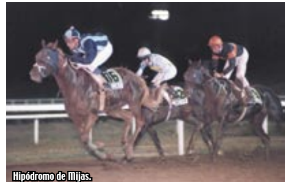
Hipódromo de Mijas.