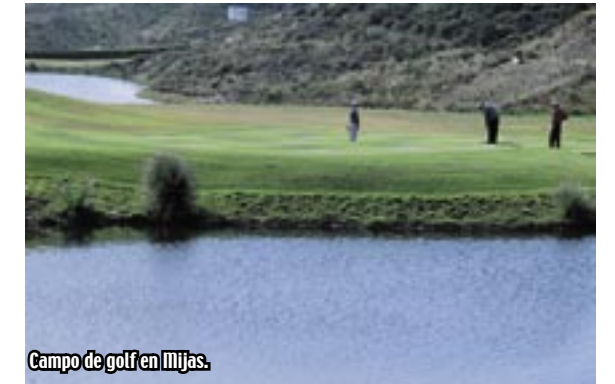
Campo de golf en Mijas.