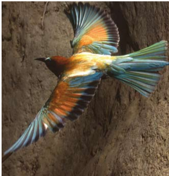
Aberaruco © Adefo - Cinco Villas