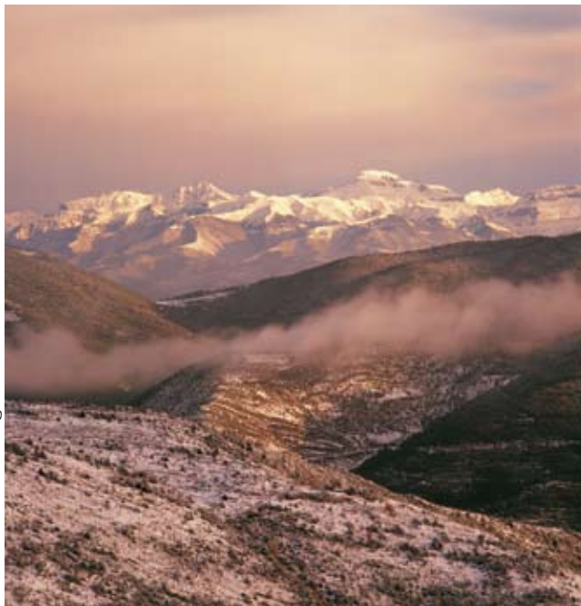
Sierra de Santo Domingo