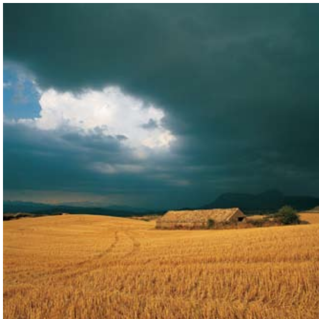
Entorno de Bañales