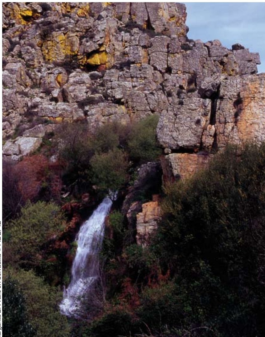
Garganta El Fraile en Serradilla