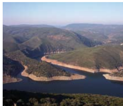
Riberos del Tajo