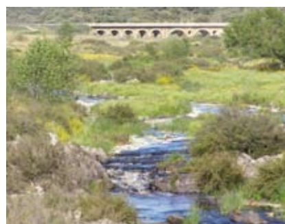
Paraje Almonte