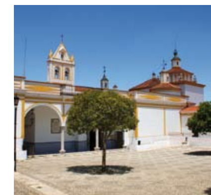
La riqueza patrimonial es tanta y tan variada que es posible adaptar la ruta a los días disponibles

pueblo que bien merece una visita. Otras poblaciones de interés son Medina de las Torres; Palomas, con su estupendo puente medieval y el aljibe mudéjar; Puebla de Sáncho Pérez; y, cómo no, Puebla de la Reina, de orígenes romanos aunque fundada por los árabes en 995. Y como la historia nace a borbotones en esta tierra, continuaremos con Puebla del Prior, donde es imprescindible la visita al Palacio de los Priors de San Marcos y a la Ermita de Nuestra Señora de Botós; Ribera del Fresno y su castillo fortaleza; los menhires de Valencia del Ventoso, así como sus villas romanas de los siglos III y IV d.C.