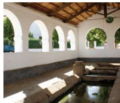
La Orden de Santiago tenía el objetivo de proteger a los peregrinos del Camino de Santiago

fiestas y tradiciones y el calor de sus gentes.