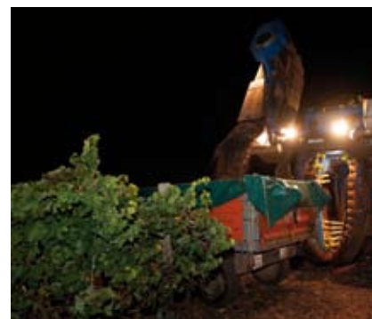
La variedad de suelos y microclimas favorece la diversidad de las uvas de Ribera de Guadiana

con una bodega bajo el graderío. Otra visita obligada en la ciudad es el Museo de las Ciencias del Vino, donde conviven el arte, la tradición y las más modernas tecnologías de la industria vitivinícola. Pero no es el único lugar donde debe detenerse el visitante. En ambas comarcas, cuyos caldos han alcanzado renombre mundial, son innumerables las bodegas, los monumentos y los paisajes que merecen ser descubiertos. La riqueza monumental e histórica de ciudades como Villafranca de los Barros, Ciudad de la Música o Zafra, declarada Conjunto Histórico Artístico, harán de esta ruta un