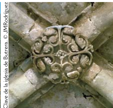
Clave de la iglesia de Butrera.

en dos fases, y es masivo, bien construido, con una decoración en ocasiones desconcertante en sus rasgos de raíz oriental. El tercero de los hitos imprescindibles es la antigua abadía seglar de Santa María de Siones, excelentemente conservada, donde la observación detenida de los detalles escultóricos del interior resultará un gratificante ejercicio.