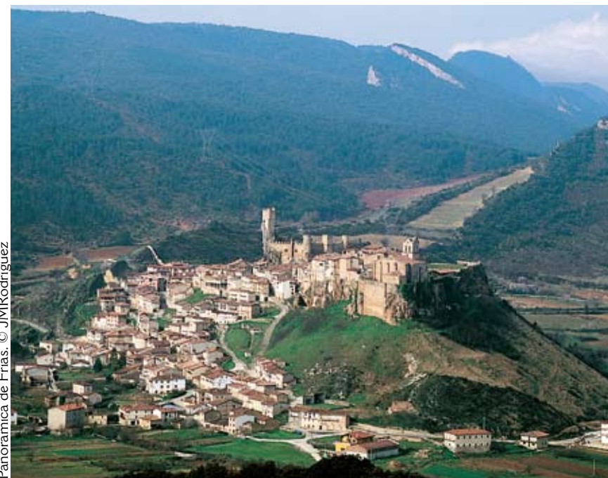
Panorámica de Frías.