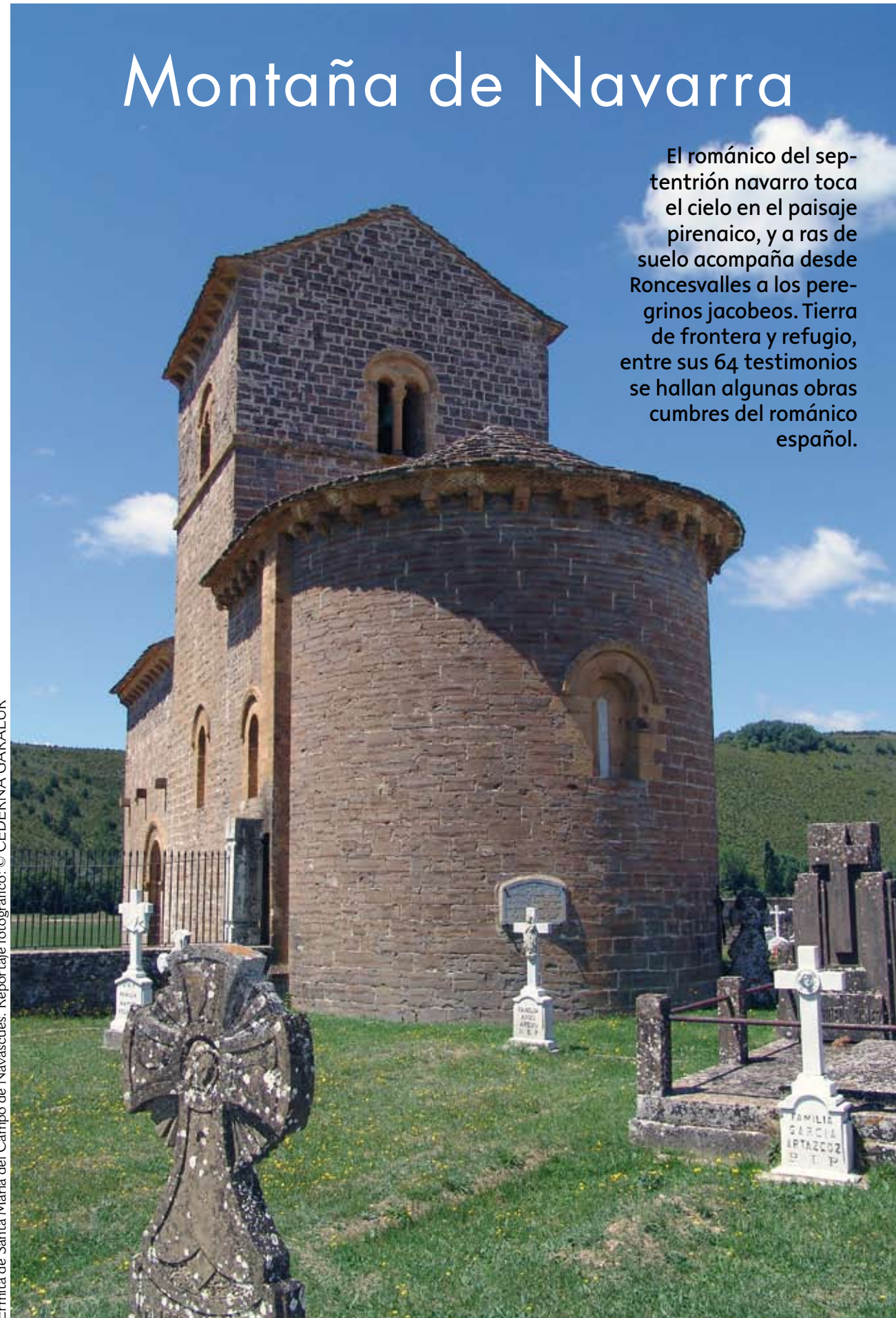
Ermita de Santa María del Campo de Navascués.

El románico del septentrión navarro toca el cielo en el paisaje pirenaico, y a ras de suelo acompaña desde Roncesvalles a los peregrinos jacobeos. Tierra de frontera y refugio, entre sus 64 testimonios se hallan algunas obras cumbres del románico español.