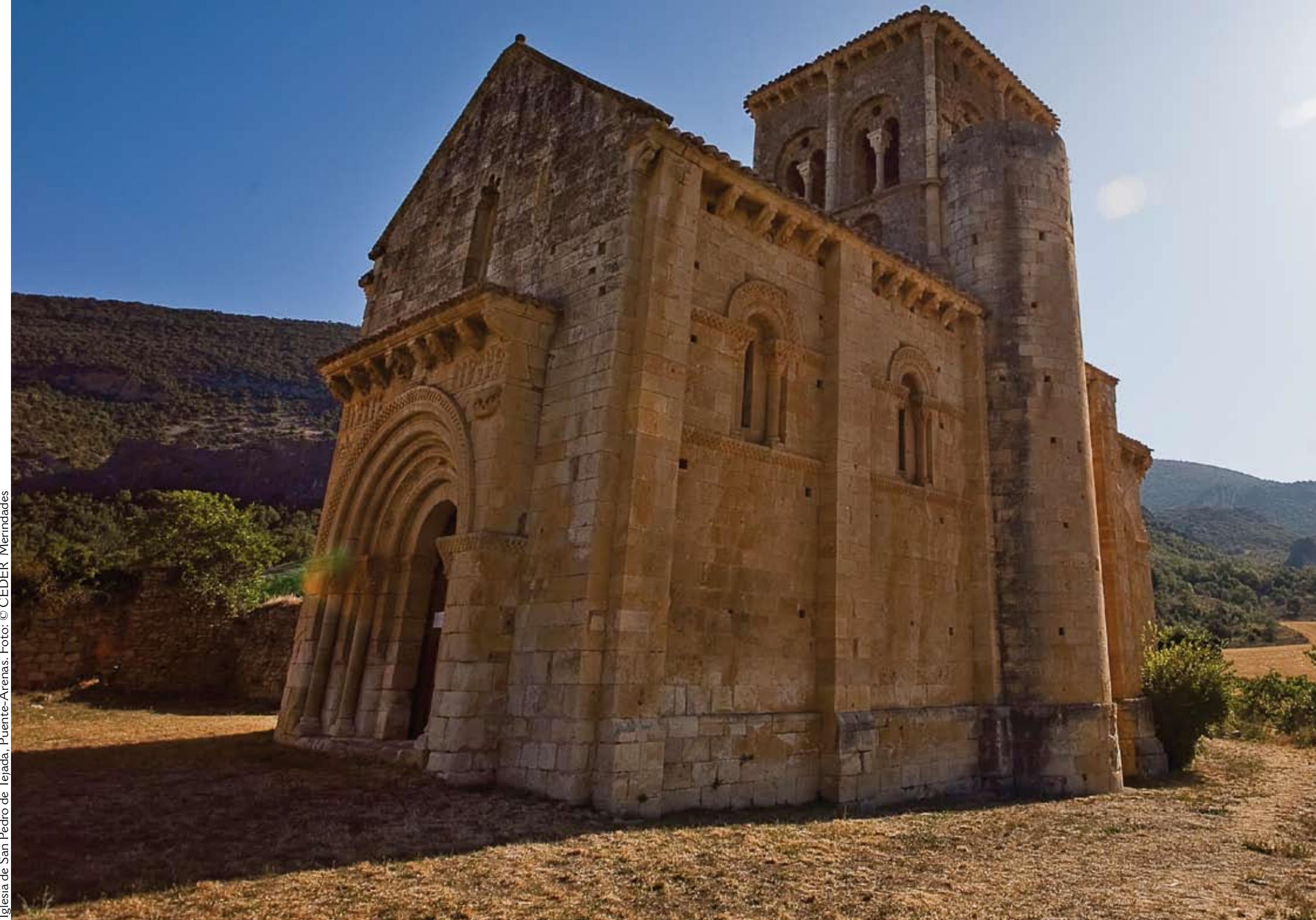
Iglesia de San Pedro de Tejada, Puente-Arenas.

San Pedro de Tejada, antiguo priorato benedictino dependiente de San Salvador de Oña, en el valle de Valdivielso, es uno de los monumentos cumbre del románico de inicios del siglo XII, perfectamente conservado.