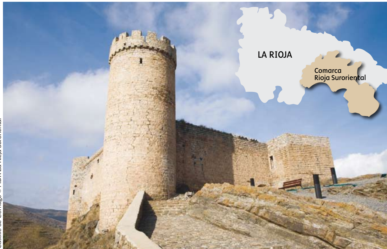
Castillo de Cornago

La Rioja Suroriental está formada por los valles del Cidacos, Alhama-Linares, Ocón y Leza-Jubera. Este territorio destaca por la belleza y diversidad de su medio natural, así como por la importancia de su patrimonio histórico, artístico y cultural.