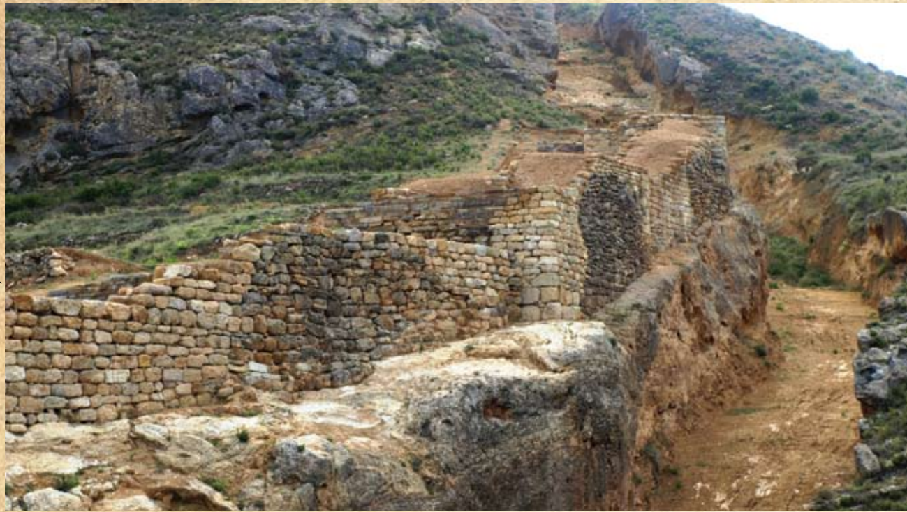
Murallas, puertas y restos del Yacimiento Contrebia de Leucade